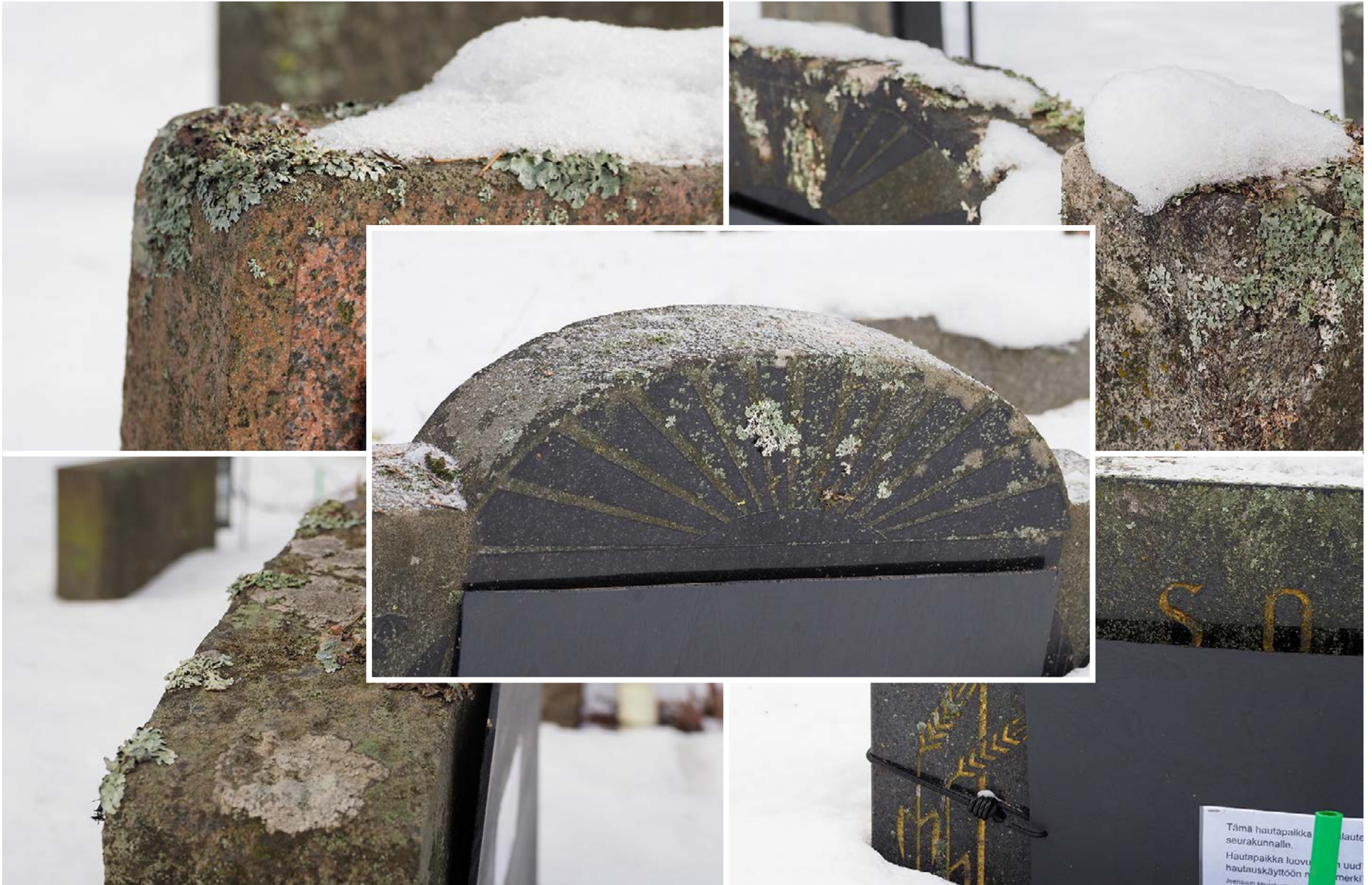
Vanhoissa hautakivissä on yksityiskohtia, joita uusiin kiviin ei ole välttämättä saatavilla. Itselle mieleistä hautapaikkaa ei voi varata etukäteen, vaan valinnan tekevät omaiset.